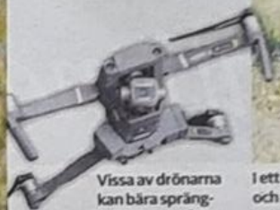
Vissa av drönarna kan bära spräng- laddningar på tre till fyra kilo.