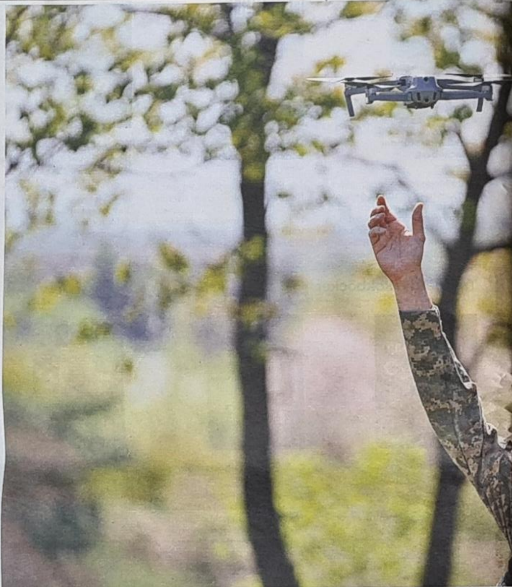
En ukrainsk soldat släpper iväg en drönare under träningen.

civila evakuerades igår från stälverket Azovstal i Mariupol, uppges Kiev, samt Rysslands försvarsdepartement. Innan evakuering bedömdes ungefär 200 civila vara kvar i tunnarna under Azovstal.