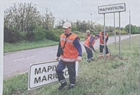
Ukrainska vägs skyltar byts mot ryska utanför Mariupol.